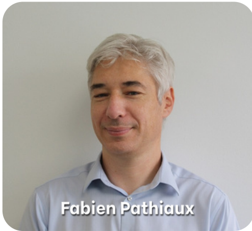
Vétérinaire, Directeur Marketing et Technique