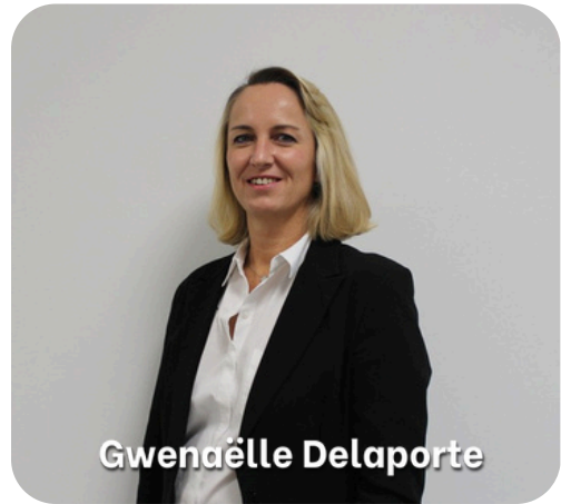
Directrice de la Communication